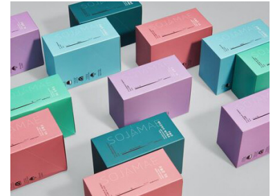
sojamae - Today's Month Coffee Packaging Client: sojamae, Gyeongsangbuk Province, South Korea Design: astudio, Seoul, South Korea Red Dot