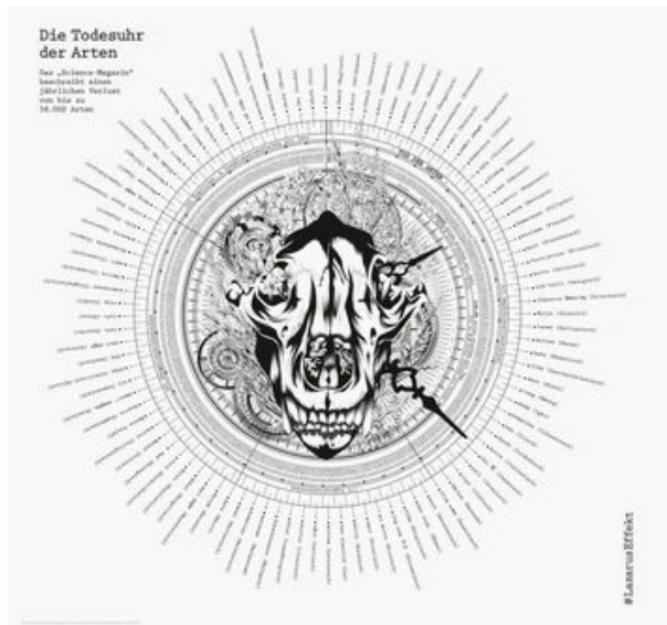
#LazarusEffect Illustration, Information Graphics, Exhibition University: University of Applied Sciences and Arts Dortmund, Dortmund, Germany Design: Lara Wilkin, Gladbeck, Germany Red Dot: Best of the Best (Red Dot: Junior Award)

Im Wettbewerbsjahr 2021 kam ein Viertel aller mit einem Red Dot: Best of the Best ausgezeichneten Arbeiten aus Nordrhein-Westfalen. Unter allen Siegern weltweit waren es fast zehn Prozent. Darüber hinaus hat die Agentur des Jahres 2021, denkwerk, ihren Hauptsitz in Köln. Diese Ergebnisse zeigen, wie stark das Bundesland im weltweiten Vergleich ist.