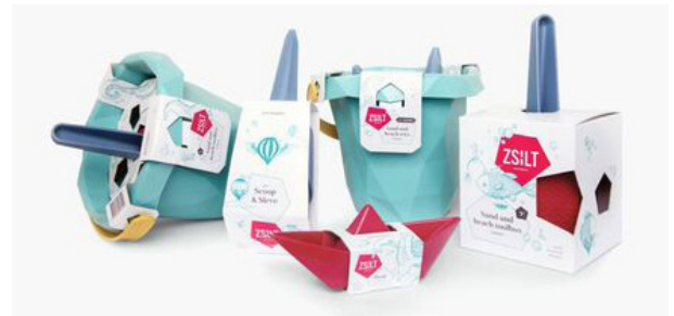
Zsilt Sustainable Beach Toys Toy Packaging Client: Zsilt, Amersfoort, Netherlands Design: Das Buro, Rotterdam, Netherlands Red Dot