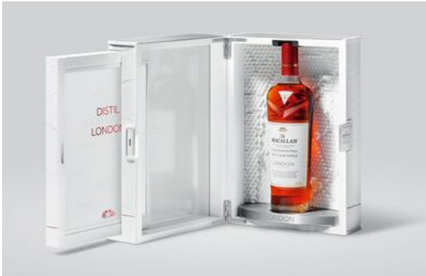
Distil Your World London Collectors Pack – The Macallan Beverage Packaging Client: The Macallan Distillers, Glasgow, United Kingdom Design: Master For You Agency, Barcelona, Spain Red Dot

Packaging design gives consumers guidance and often determines a product's success at the point of sale. Packaging solutions are complex works of art that appeal to all of our senses in order to pique our interest within a few short seconds. Packaging also has a lot of practical functions, such as protecting the product during transportation.