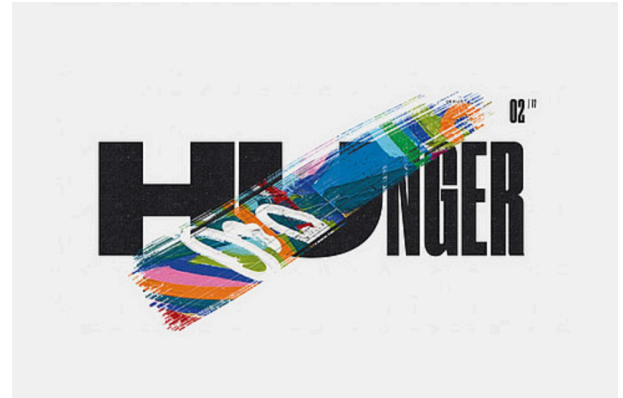
Art4GlobalGoals – Piece 18

In the exhibition, denkwerk presents itself with a digital installation.