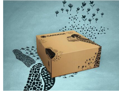
Gardena E-Commerce Packaging Design Client: GARDENA, Ulm, Germany Design: Berndt+Partner Creality, Berlin, Germany Red Dot: Best of the Best