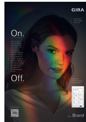
GIRA Smart Building Brand Client: Gira Giersiepen, Radevormwald, Germany Design: thjnk Düsseldorf, Düsseldorf, Germany Red Dot: Smart Building Brand