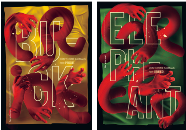
Don't Hurt Animals for Greed/Pride/Envy Design: Unite Design, Taipei (Taiwan) Red Dot: Best of the Best

For a long time, posters were the most efficient means of conveying a message to the public. Nowadays there are lots of alternatives, yet posters are still as attractive as ever. We encounter them everywhere – in buildings, on the street and in every country and culture. There's one thing that all the best posters have in common: They are striking and try by all means to arouse curiosity and attract attention.