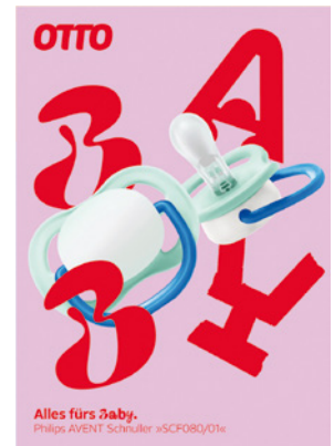
Your Life in Four Letters Client: Otto, Hamburg Design: Mutabor Design, Hamburg Red Dot: Best of the Best