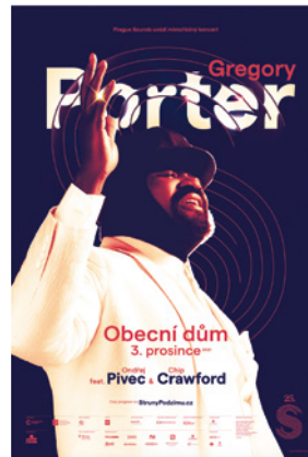
Prague Sounds Client: Prague Sounds (Czech Republic) Design: Petr Skala, Prague (Czech Republic) Red Dot